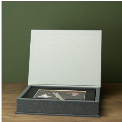
Passe-Partout fotobox (incl. digitaal bestanden)

inclusief 10 foto's 20x30 met passe-partouts inclusief de 10 foto's digitaal