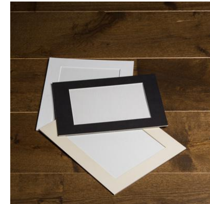
Passe-Partouts met print (incl. digitaal bestand)

30x20 € 50 45x30 € 60 60x40 € 75 90x60 € 95 105x70 €125