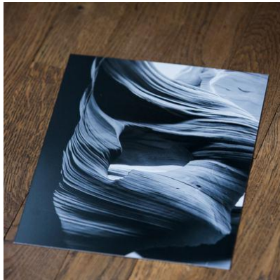
Losse prints (incl. digitaal bestand)

Naast de digitale bestanden die je ontvangt, is er de mogelijkheid om digitale bestanden bij te kopen en / of andere foto's te laten afdrucken. We weten allemaal dat je foto's op je telefoon vaak niet goed weet terug te vinden of je bekijkt ze nauwelijks meer. Hoe mooi is het om de foto's een meerwaarde te geven door ze in hoge kwaliteit af te laten afdrucken? Zo kunnen ze, op die mooie plek in huis, jou altijd helpen herinneren aan deze speciale fotoshoot!